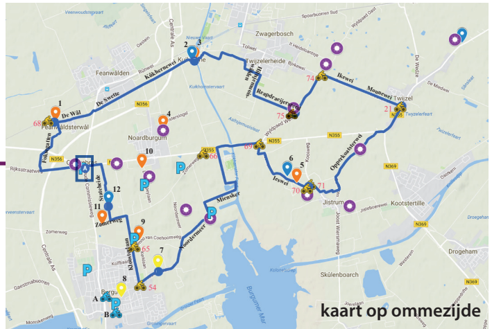
kaart op ommezijde

leswei 10, Boer Broersma-Van der Meer (nr 6)